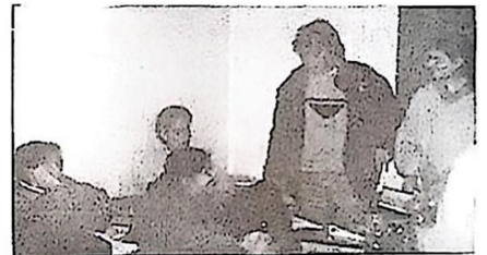
Vista integral de las aulas. (tomada con la espalda del fotógrafo pegada al fondo del aula). Para entrar y desplazarse dentro del aula deben levantarse los alumnos... Aquí todo es compartido... el espacio, los bancos, los exámenes, etc. etc. También se previó no poner un escritorio para los profesores (para que la clase sea más activa ... vió!!)